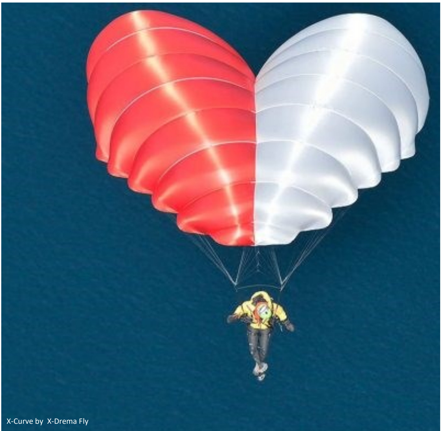
X-Curve by X-Drema Fly

Je n'ai certainement pas répondu à toutes les questions. Mais vous pouvez me les transférer par mail sur contact@parapente360.com