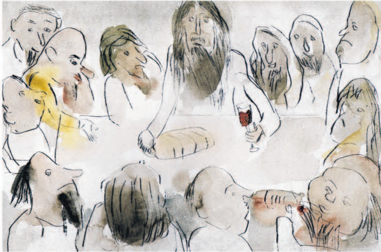
Bilder zur Passion zeigt die neue Ausstellung mit Werken des Berliner Künstlers Kurt Mühlenhaupt (1921–2006) im Krankenhaus Hedwigshöhe, Bohnsdorf. Die Vernissage beginnt am 9. März um 16.30 Uhr.