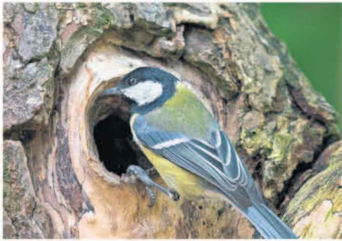
Kohlmeisen sind Höhlenbrüter. Finden sie keinen geeigneten Baum, nehmen sie gern Nistkästen an.

Berlin. Schnee und Eis hatten die Stadt viele Wochen fest im Griff. Doch bei den Vögeln regen sich bereits Frühlingsgefühle: Die Änderung der Tageslänge leitet ihr Paarungsverhalten ein. Deshalb sind trotz Schnee und Eis schon Mitte Februar die ersten Frühlingsgesänge zu hören. Die heimischen Arten, die in Deutschland den Winter verbringen, haben gegenüber Zugvögeln den Vorteil, bereits jetzt Ausschau nach geeigneten Brutquartieren halten zu können. Wer den in Höhlen oder in Nischen brütenden Vögeln ein komfortables Quartier anbieten möchte, kann jetzt schon damit anfangen.