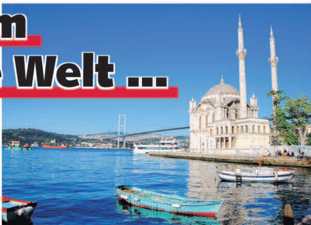
Istanbul ist die einzige Stadt der Welt, die sich über zwei Kontinente erstreckt – der die Stadt teilende Bosphorus ist die Grenze zwischen Europa und Asien.

Afrika zeigt sich auf der touristischen Landkarte als boomender