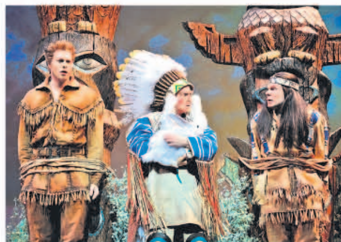
Apachenhäuptling Abahachi (r.) und sein weißer Blutsbruder Ranger sind Gefangene des Schoschonenhäuptlings Listiger Lurch.

Charlottenburg. Wer sich schon im Film „Der Schuh des Manitu“ über die Dialoge schlapp gelacht hat, dessen Lachmuskeln werden auch im gleichnamigen Musical arg strapaziert. Wer allerdings eine Kopie des Films erwartet, wird enttäuscht. Dafür unterliegt ein Musical anderen Gesetzen als ein Film.