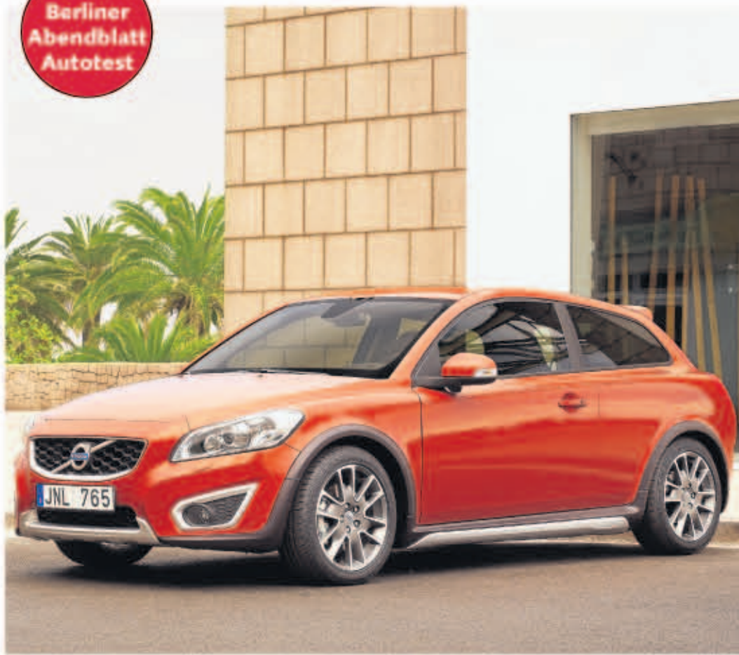
Den C30 zierte nun eine modifizierte Frontpartie mit vergrößertem Markenlogo.