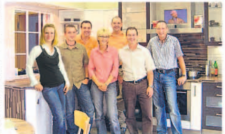
Das Küchentreff-Team freut sich auf seine Gäste.

Davon kann man sich selbst überzeugen. Denn das Küchensstudio lädt am 13. März von 10 bis 19 Uhr zur Kochshow „Bella Italia“ ein. Für alle, die auf eine gesundheitsbewusste Ernährung achten, wird es viele geniale und einfache Rezepte geben, die man zu Hause leicht nachkochen