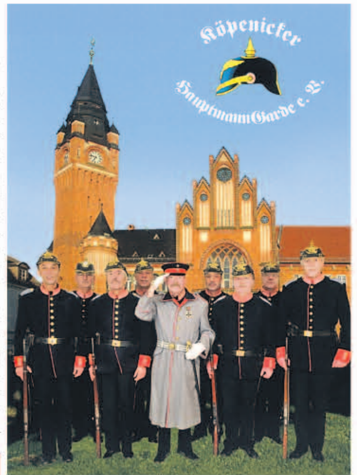
Saisonstart. Am Samstag, 6. März, ist es wieder so weit. Dann startet die Köpenicker Hauptmanngarde in die neue Tourismussaison. Unter dem Kommando des Schusters Voigt wird ab sofort jeden Mittwoch und Samstag zur Freude aller Schaulustigen das Köpenicker Rathaus gestürmt. Beginn ist immer um 11 Uhr. Für weitere Informationen bitte eine Mail schicken an die Adresse koepenicker_hauptmanngarde@online.de.

GEHEN SIE AUF NUMMER SICHER MIT ATTRAKTIVEN