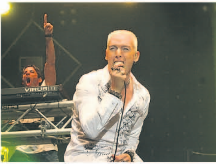
Hans Peter singt in der Arena

Treptow. Wer hätte dereinst gedacht, dass der kleine Hans Peter aus Ostfriesland als Star auf den Bühnen Europas unterwegs sein würde? Selbst später sah es kaum nach multinationalen Erfolgen aus, als er einige Semester Jura studierte und dann doch lieber Industriekaufmann wurde. Auch davor flüchtete er – in einen Plattenladen: endlich Geborgenheit durch und mit Musik. Der Weg zu einer Plattenfirma gestaltete sich wechselhaft, aber unaufhaltsam positiv. 1986 lernte er Rick J. Jordan über eine Anzeige kennen. 1988 bis 1991 machten sie gemeinsam Synthesizer-Pop. Ihre Gruppe „Celebrate The Nun“ war danach Geschichte. Hans Peter nannte sich bereits einige Zeit H.P. Baxxter. Nun hatte er auch noch die richtige Idee: mit Remixen bekannter Künstler groß herauszukommen. Im Sog der Bekanntheit von Holly Johnson (Frankie Goes to Hollywood) und Marky Mark gelang dies zwar partiell,