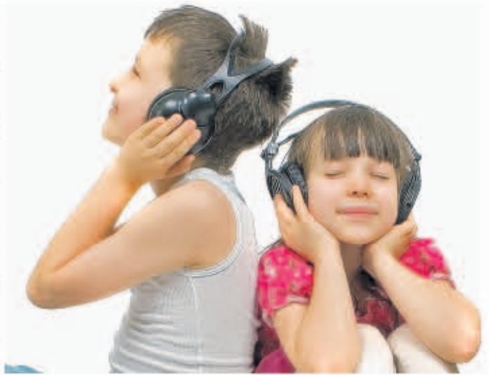
Hören und räumliches Vorstellen

Treptow. Hören und das räumliche Vorstellungsvermögen gehören zu den wichtigsten Lernvoraussetzungen für das Lesen-, Schreiben- und Rechnenlernen. Mit dem kostenlosen Kurs „Augen auf und Ohren gespitzt“ bieten die Leserechtschreib-Schulen der Studienkreise Pankow und Treptow Grundschulkindern anlässlich der Testtage die Möglichkeit, dieses zu trainieren. Vom 8. bis zum 12. März können interessierte Eltern ihre Kinder in den Studienkreisen anmelden.