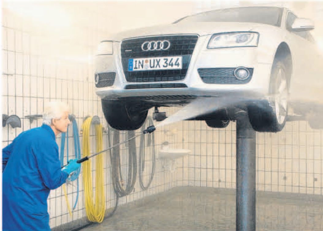
Eine gründliche Reinigung lässt den Pkw nicht nur in neuem Glanz erstrahlen, sie wirkt sich auch positiv auf dessen Werterhalt aus.