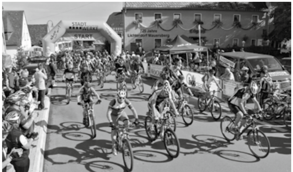
Volksfeststimmung im Mauersberger Erbgerichtshof während des Starts zum Annaberger-Landring-Radeln.

„Hart, aber herzlich“ – unter diesem Motto könnte das diesjährige Radevent durch das obere Erzgebirge gestanden haben!