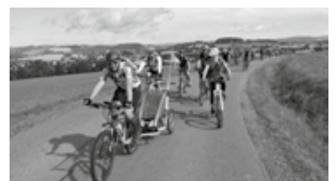
Ein faszinierendes Panorama bot sich den Radlern unterwegs mehrfach, so wie hier auf dem Abschnitt zwischen Mildenau und Grumbach.

Andi Weinhold Verein Annaberger Land e. V.