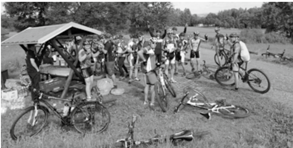
Sowohl die Teilnehmer der Familientour als auch die der Sporttour hatten am Wanderparkplatz Obermildenau zur Rast die Gelegenheit, „aufzutanken“.

Die familiäre Atmosphäre wurde von vielen Seiten gelobt, wenngleich es für kommende Austragungen gilt, die Streckenführung hinsichtlich der zu absolvierenden Höhenmeter mit Blick auf topografische Besonderheiten unseres Erzgebirges doch etwas zu korrigieren.