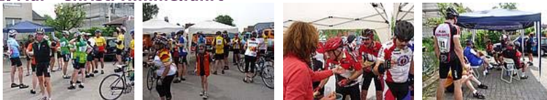
Zum Vergrößern klicken!