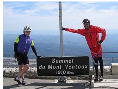
Zum Vergrößern in die Bilder klicken!