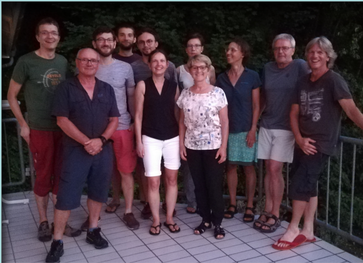
Der neue Vorstand