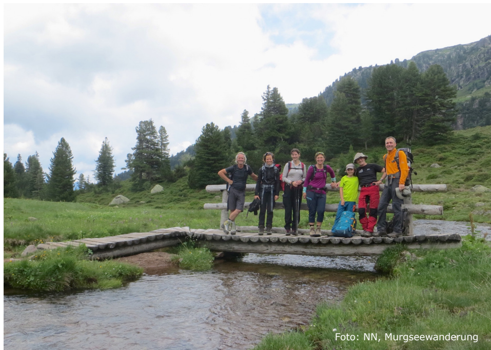
Murgseewanderung