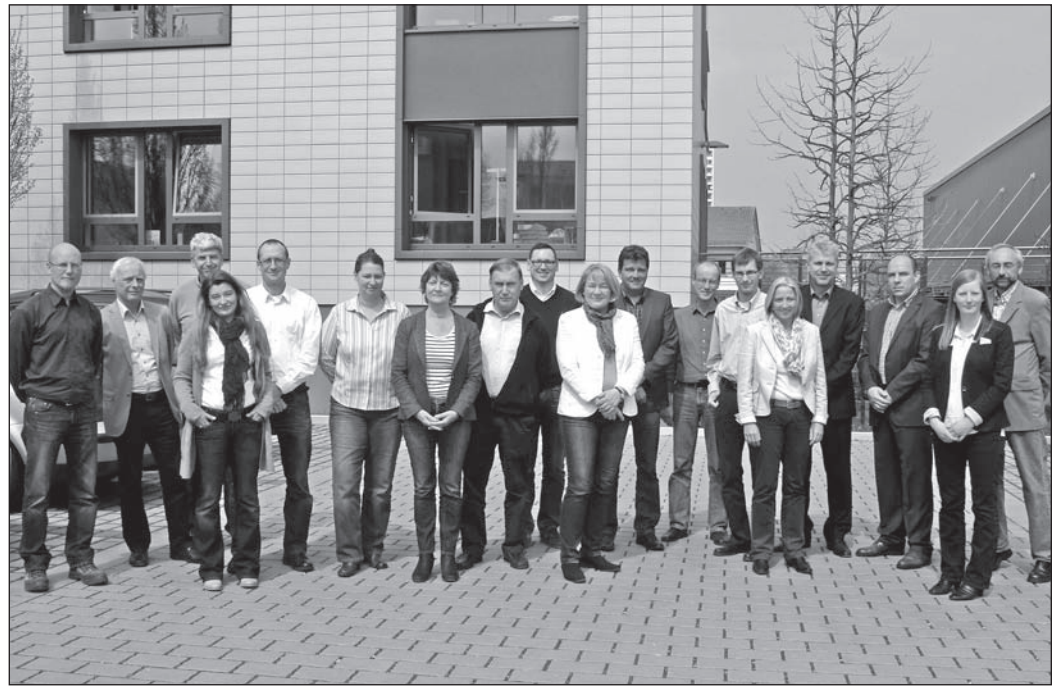
Die Teilnehmer des „Ökoprofit Hochtaunus Klubs 2013/2014“ trafen sich zur vierten Klubrunde bei der Willy A. Löw AG in Bad Homburg zum Erfahrungsaustausch.

dadurch Dienstfahrten nach Hamburg, Bremen oder München. Das Autohaus Weil in Friedrichsdorf vergibt an seine Kunden Leihfahrzeuge statt Leihwagen, was sehr gut angenommen wird. Auch Elektroautos werden als Leihwagen zur Verfügung gestellt.