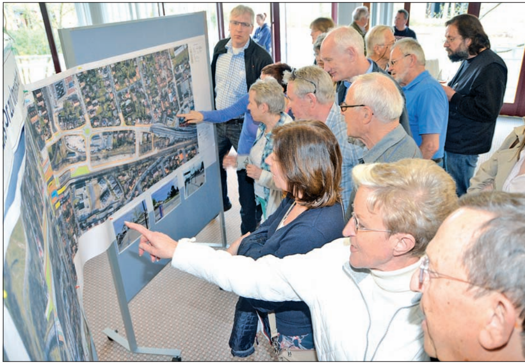
Groß war in der Bürgerversammlung das Interesse der Besucher an den Planungen der Stadt und an Alternativvorschlägen, die von Bürgern erarbeitet wurden.