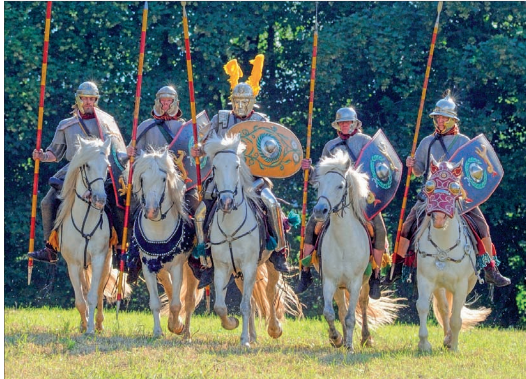
Vorfürungen der römischen Kavallerie sind am Sonntag in der Saalburg zu sehen.

Vorfürungen und Aktivitäten: Reitervorführung römischer Kavallerie um 11.30, 13.30 und 15.30 Uhr; Bogenschießen (wetterabhängig); Pferderennen mit Steckenpferden für Jung und Alt; Führungen ab 10 Uhr stündlich bis 16 Uhr und Basteln für Kinder. Der Eintritt beträgt an diesem Tag sieben Euro für Erwachsene und fünf Euro für Kinder. Die Familienkarte kostet 14 Euro. Es gibt keine Ermäßigungen und Gruppenpreise. Im Eintritt ist die Teilnahme an allen Führungen und Aktionen eingeschlossen. Die römischen Reiter sind auch noch nach dem Thementag vom 29. April bis 8. Mai mit Vorführungen auf der Saalburg präsent. An diesen Tagen gelten die üblichen Eintrittspreise für das Römerkastell Saalburg. Die Sonderaktionen sind kostenfrei.