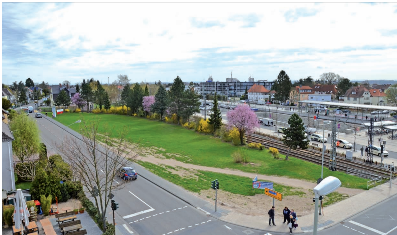
Um die Verkehrsführung am Bahnhof ging es am Dienstag in einer Bürgerversammlung. Ein von Bürgern erarbeiteter Vorschlag sieht vor, dass der Kraftfahrzeugverkehr über die Grünfläche und die U-Bahn-Gleise hinweg an die S-Bahn-Trasse herangeführt wird.