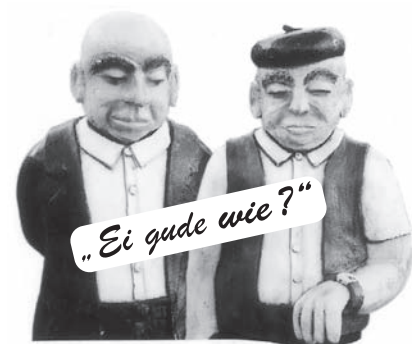
„Schaa & Schambes“ sind im Aumühlenhof der Aumühlenresidenz zu Hause.