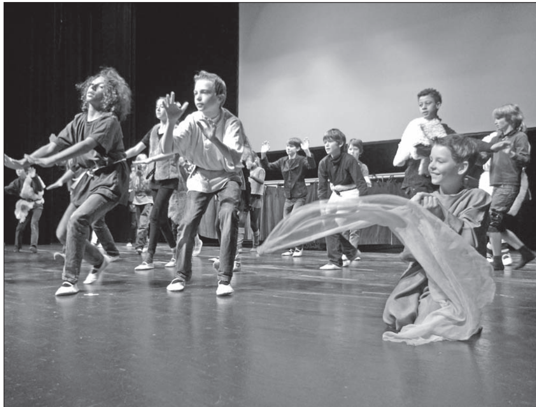
Die 4. Klasse der Waldorfschule stellte bei der Frühlingsfeier in der Stadthalle den „Hunnenzug“ dar.