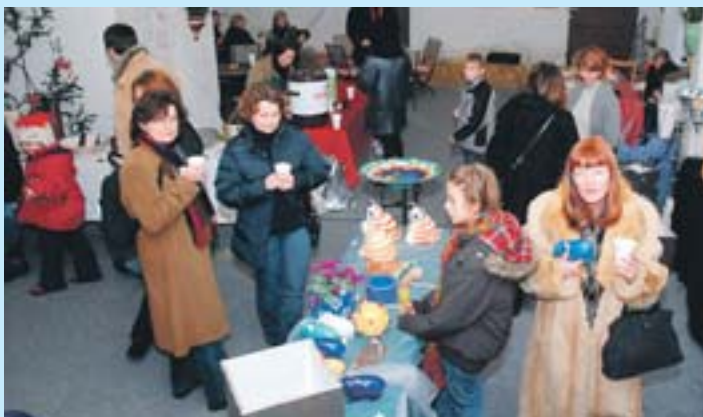
Bei Punsch und Imbissen schlenderten die Besucher durch den Bazar.