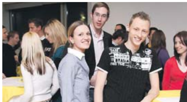
In chilliger Atmosphäre erfahren Studierende mehr über aktuelle Logistik-Forschungsergebnisse.