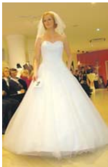
Weiß – der ewige Klassiker

Steinecker Hochzeitshaus, Hauptstraße 34, 3263 Randegg, Terminvereinbarung unter Tel. 07487/5000. Die Braut wählt die Durchwahl 62, der Bräutigam die Durchwahl 50. Mehr auf www.steinecker.at Anzeige