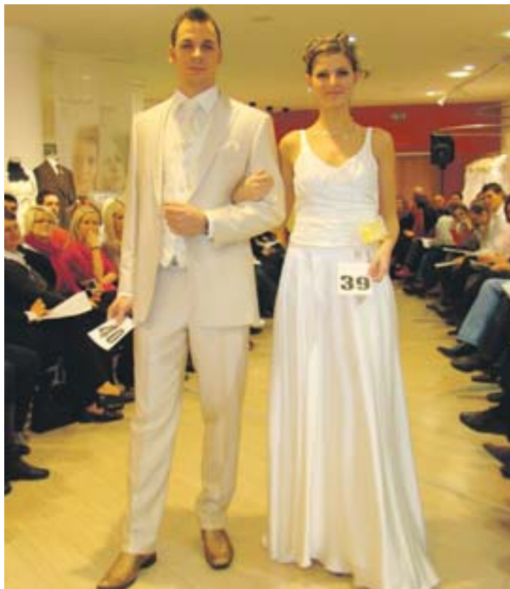
Der letzte Schrei oder traditionell, schlicht und elegant oder auffällig und pompös, klassisch weiß oder absolut angesagt in schwarz: Erlaubt ist, was gefällt.