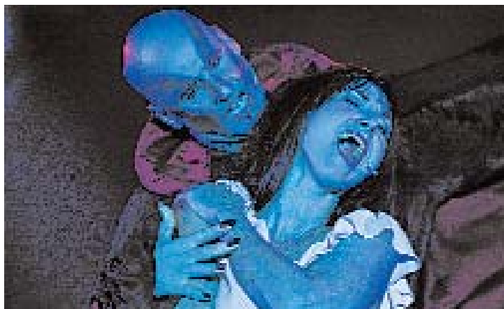
Die schönsten Melodien aus den bekanntesten Musicals vereint in einer Show.

Seit zehn Jahren zieht die erfolgreichste Musicalgala aller Zeiten die Zuseher in ihren Bann. Im Zuge der Jubiläumstournee stimmen die Starsolisten der Originalproduktion ausdrucksstark und in traumhaften Kostümen die