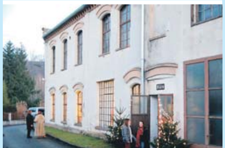
In der ehemaligen Besteckfabrik ist jetzt das Keramikatelier Seckauer untergebracht.