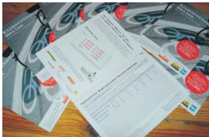
Die Sammelkarten gibt es als praktischen Folder oder digital.

Jede teilnehmende Organisation hat die Chance einen Bargeldpreis