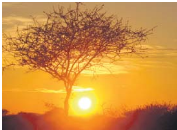
Afrika ist berühmt für seine spektakulären Sonnenauf- und -untergänge.