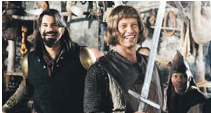
Die „1 1/2 Ritter“ machen sich auf die Suche nach Herzeline.

begegnet ihnen und dem Zuschauer ein bisher unbekanntes Mittelalter, das verblüffende Parallelen zur Gegenwart aufweist: Die Ritter tragen etwa feinste Markenrüstungen, die Super-Minnesänger werden mittels Casting ermittelt, das Essen ist in Ride-Ins erhältlich und die Leib-eigenen der Fürsten arbeiten in Gleitzeit ... Kinostart „1 1/2 Ritter“: 18. 12. 08