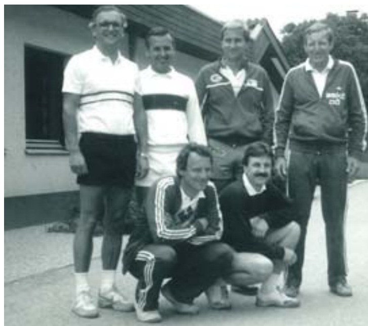
1978 etablierte sich ein Verein der Tennisfreunde.