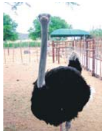
Nicht schön, aber heiß begehrt.