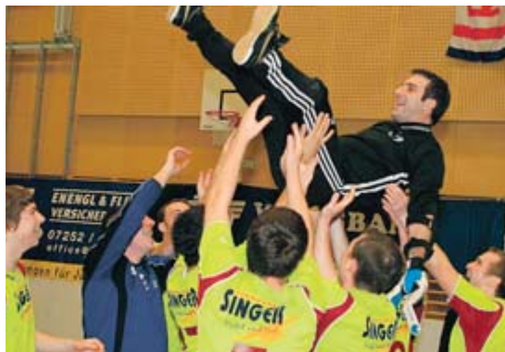
Ausgelassen feierte St. Ulrich im letzten Jahr den Sieg im Hallencup.

Titelverteidiger ist St. Ulrich, der mit Garsten, Neuzeug, Dietach und Sierning in einer Gruppe spielt. In Gruppe B wird nicht nur um den Einzug ins Hallencup gekämpft, sondern auch um den Steyrer Hallentitel. Vorwärts Steyr, ATSV Steyr, Bewegung Steyr, ATSV Stein und der Veranstalter werden um