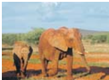
Familienausflug in die Steppe.