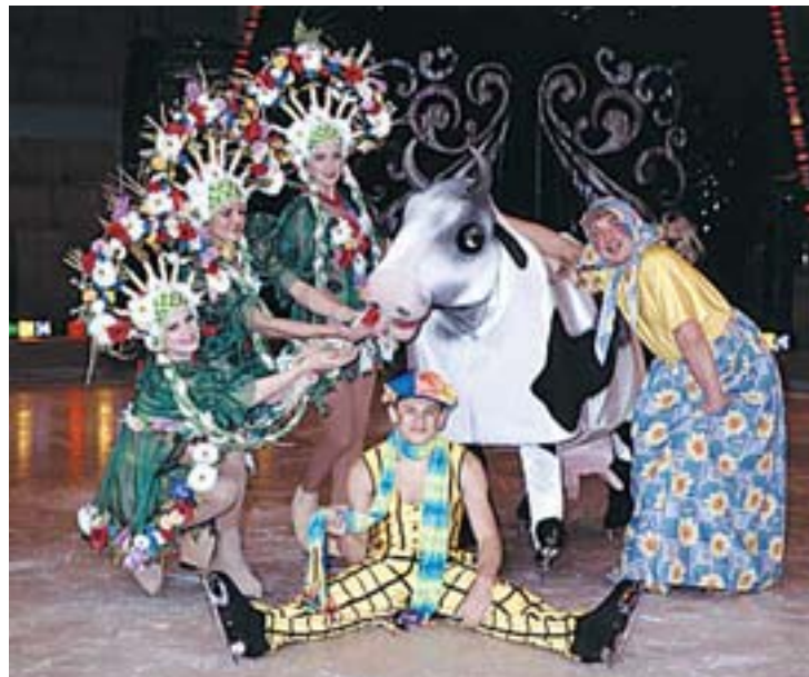
„Moscow Circus on Ice“ vereint in einzigartiger Form die Kunst des Eislaufens mit dem Facettenreichtum eines traditionell russischen Zirkusprogramms.

Karten sind in allen Raiffeisenbanken, Ö-Ticket Stellen (Sparkassen, Media Markt u. a.), Kartenbüros und unter 07248/62975 erhältlich. Kinder zahlen die