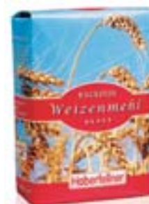
Das Haberfellner-Backfein-Mehl: Ein regionales Qualitätsprodukt.