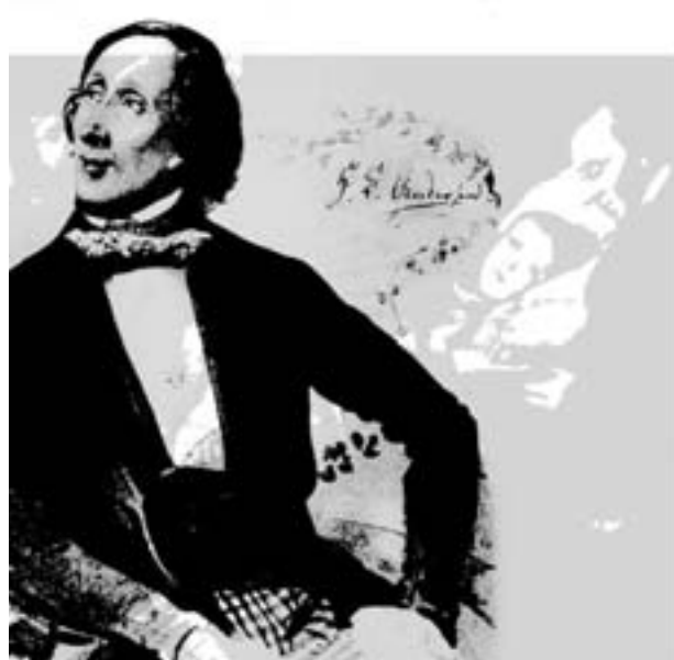
Seine Märchen haben Hans Christian Andersen weltberühmt gemacht.

Sein unerschütterliches Lebensziel, eine Berühmtheit zu werden, hat Hans Christian Andersen erreicht. Doch wie hat er es geschafft ein auf der ganzen Welt gefeierter Märchendichter zu werden? Passend zur Vorweihnachtszeit versetzt der Hans Christian Andersen - Abend, am Freitag, 19. Dezember 2008, um 19 Uhr im AKKU Kulturzentrum, zurück in das Zeitalter der Romantik und widmet sich dem Werk und der schier unglaublichen Lebensgeschichte des großen Märchenerzählers. Der Abend lädt zum Staunen ein, zum sich Berühren lassen und zum