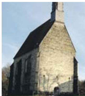
Die Kirche von St. Blasien in Bad Hall.