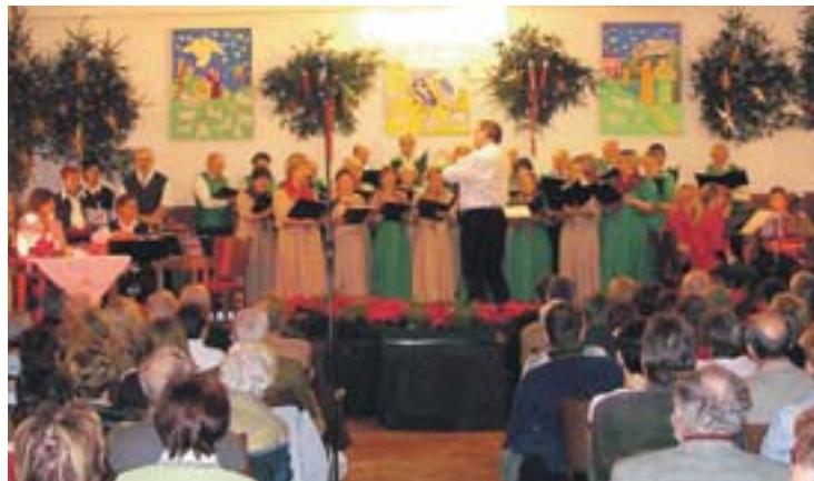
Mit einem stimmungsvollen Adventkonzert ließ die Chorgemeinschaft Stahlklang ihr Probenjahr ausklingen.

Zeichen des Haydn-Jahres. Die Chorgemeinschaft feiert das Jahr nicht nur mit einem Konzert in Steyr, sondern auch mit einem Auftritt in Deutschland. Die Chorgemeinschaft wird am großen Jubiläumskonzert der „Konkordia 1849“ in Heusenstamm bei Frankfurt teilnehmen.