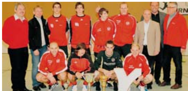
Titelverteidiger Bewegung Steyr will den Stadtmeistertitel erfolgreich verteidigen.

den Titel kämpfen. Titelverteidiger Bewegung Steyr zählt auch dieses Jahr zu den Favoriten. Gespielt wird in den Gruppen nach dem Meisterschaftssystem und die beiden besten jeder Gruppe ermitteln in Kreuzspielen die beiden Finalisten. Gespannt sieht man dem Auf-