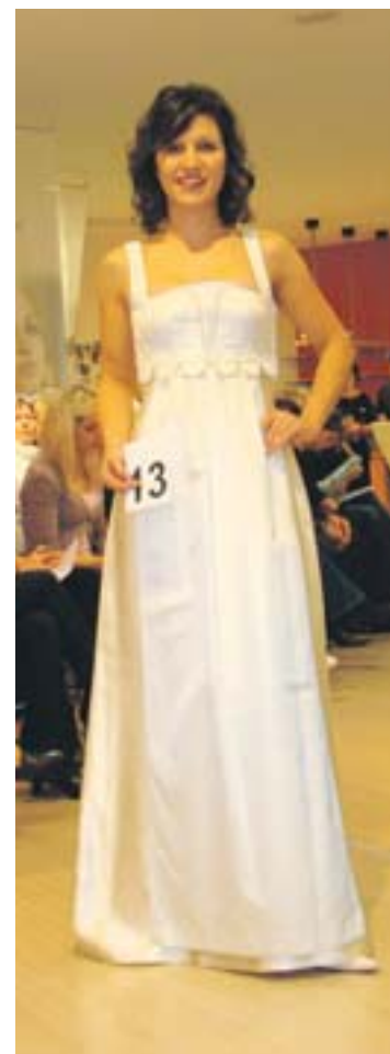
Eine Braut zum Verlieben schön.