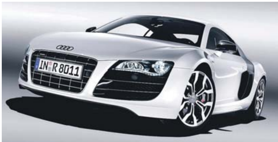
Doppelsieg für den Audi R8 bei der Wahl „World Car of the Year Awards 2008“

5.2 FSI quattro 386 kW/525 PS Verbrauch: 13,7 Liter/100 Kilometer Im zweiten Quartal 2009 rollt der Audi R8 5.2 FSI zum Grundpreis von 177.800 Euro an den Start.