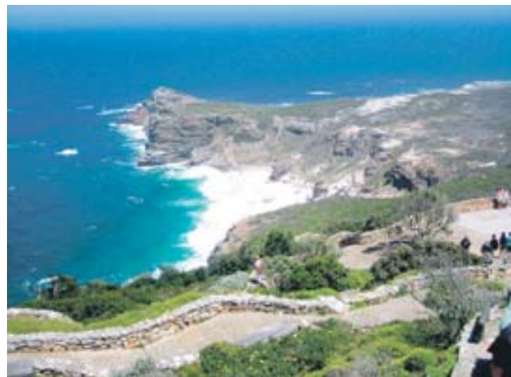
Der Blick auf das Kap der Guten Hoffnung ist atemberaubend.