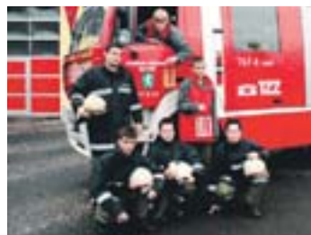
Die Wehrler warten mit dem Licht.

Mi., 24. 12. 2009, 7-16 Uhr Feuerwehrhaus Münichholz