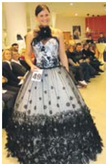
Schwarz – der jüngste Hochzeitstrend