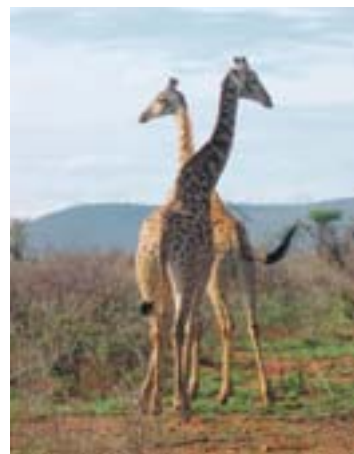
Eleganz in Reinform.