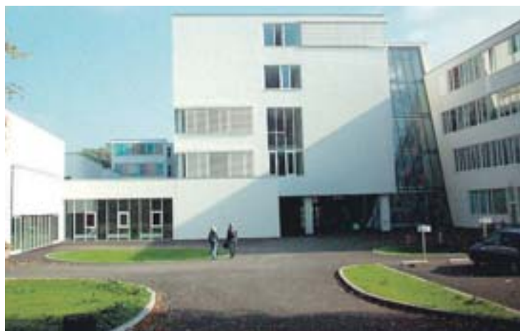
Eine Führung durch das Schulgebäude steht ebenfalls auf dem Programm.

maximal 70 Prozent erzielt werden kann“, erklärt Monika Nagler, Oberärztin an der Abteilung für Neurologie. In Steyr werden bereits über zehn Patienten mit dieser Therapieform betreut. Positiv sind die geringen Nebenwirkungen, wie auch die günstige Wirkung auf Wachheit, Aufmerksamkeit und Stimmung.