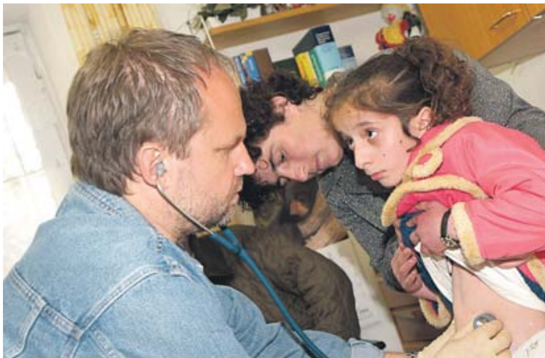
In den betroffenen Regionen untersuchen die Ärzte die Kinder und entscheiden über die weitere Vorgehensweise.

Natürlich. Wenn ich wirklich das Ziel verfolge, die Welt zu retten, wie ich vorher gesagt habe, dann müsste man nach 14 Tagen zweifeln. Aber man kann dann entscheiden: Macht man weiter, oder lässt man es bleiben. Wir wissen, dass wir die Gesamtsitu-