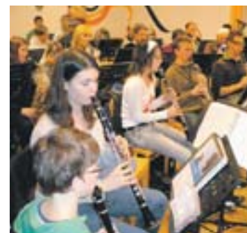
Der Musikverein Christkindl bei den Vorbereitungen