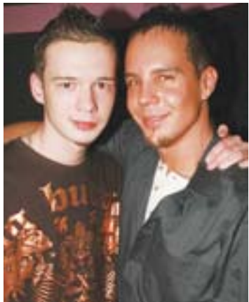
Im Club Boom herrschte am Freitag, dem 12.12.08 gute Stimmung die ganze Nacht lang!!