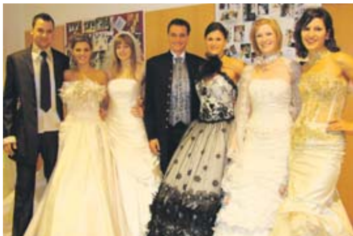
Im Hochzeitshaus Steinecker werden Braut und Bräutigam garantiert fründig.