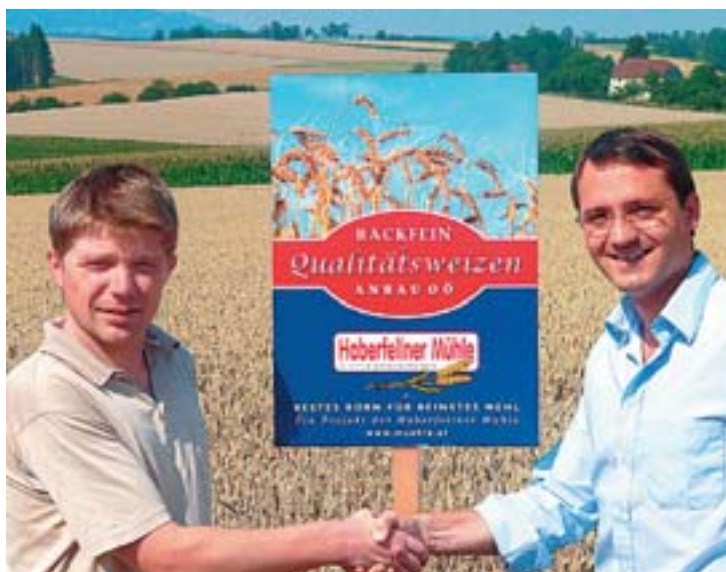
Haberfellner setzt auf regionale Vertragsbauern.

Mittlerweile werden bereits über 3.000 Tonnen Backfein-Qualitätsweizen in Oberösterreich angebaut. Ziel ist es, diesen Vertrags-