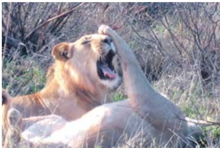
„The Lion sleeps tonight“ – Löwen sind im Rudel die absoluten „Kuschler“.

Südafrika bietet aber noch viel mehr. Städte wie Kapstadt oder Johannesburg präsentieren High