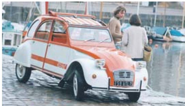
1990 lief der letzte 2CV der Geschichte vom Produktionsband.

jekt jedoch gestoppt und sollte erst zehn Jahre später in die Serienproduktion gehen. 1948 war es soweit, beim Pariser Automobilsalon Mondial wurde der Citroen 2CV präsentiert. Bald darauf wurde das sympathische Citroen Modell 2CV (französisch: deux cheveaux) aufgrund der lautsprachlichen Verwandtschaft mit deuche bald „die Ente“ getauft.