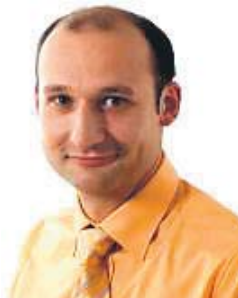
Reinhard Kirchberger Concept Center GmbH

schaftstreibende aus den Bezirken Steyr und Steyr Land greifen daher in puncto Werbung gerne zum wöchentlichen Gratisblatt.