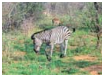
Streifen sind groß in Mode.

Kurz gesagt: Südafrika muss man erlebt haben!